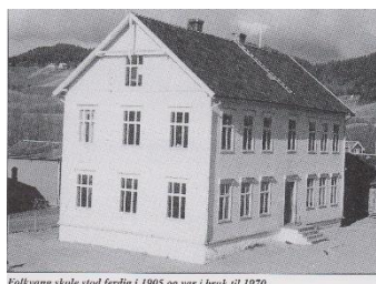
Folkvang skole stod ferdig i 1905 og var i bruk til 1970.